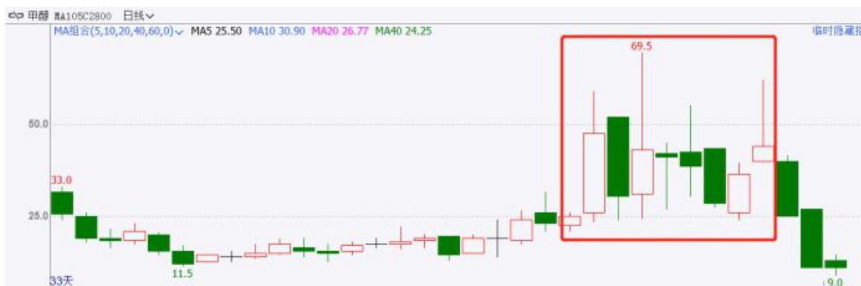
图 2：MA105C2800 近期走势

在 2 月 26 日时，甲醇跌幅超过 2%，若看多的投资者不想继续重仓期货，可以选择轻仓买入甲醇期权来管理上涨行情的尾部盈利。我们事后复盘一下，如果在 2 月 26 日以收盘价 30.5 元/吨买入深度虚值看涨期权 MA105C2800，持有至 3 月 8 日以最高价 62 元/吨附近卖出，则使用期权进行尾部盈利管理的收益率超过了 100%，轻仓也会产生较为可观的盈利。